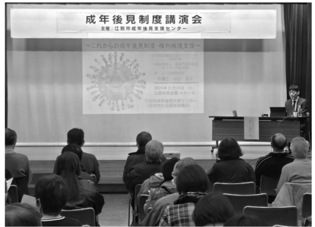
89名の市民の皆様に参加いただきました

皆様のご意見をもとに、今後も成年後見制度についての理解が深まるような企画をしていきたいと思います。