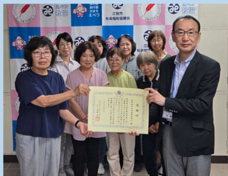
野幌地区女性団体協議会様から慈善バザーの益金を寄付いただきました