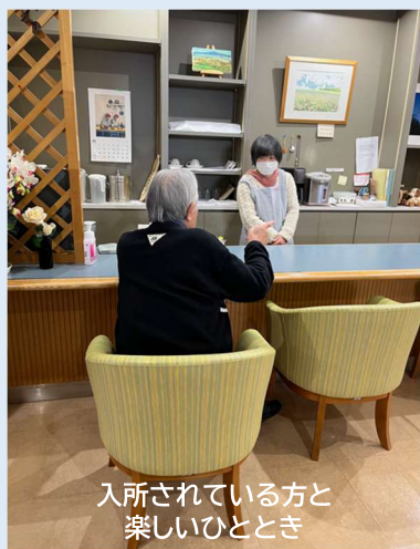
入所されている方と 楽しいひととき

「ゆかりの会」は、3月まで活動していたボランティア団体(ナルク江別)を解散後にその活動を縮小し、2025年4月に改めてボランティア団体連絡会に登録させていただきました。