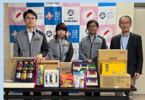
角山開発(株)様から食料品を寄贈いただきました