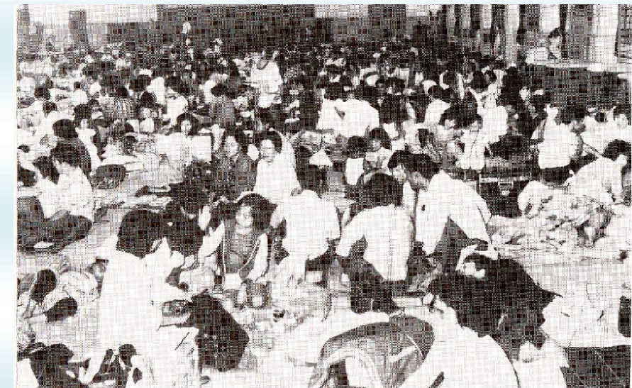
昭和56年8月江別市集中豪雨・江別小学校避難所